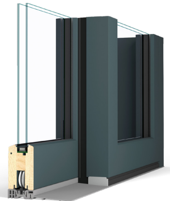
Coulissant levant seuil rénovation sur dalle existante